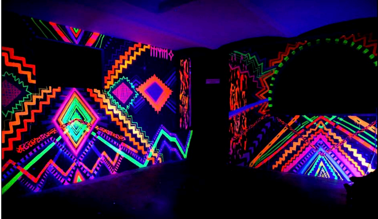
Mimo Mali, Light in the Darkness, 2013, Ultraviolet Sun portal Installation

Ausstellung: LIGHT IN THE DARKNESS von MIMO MALI