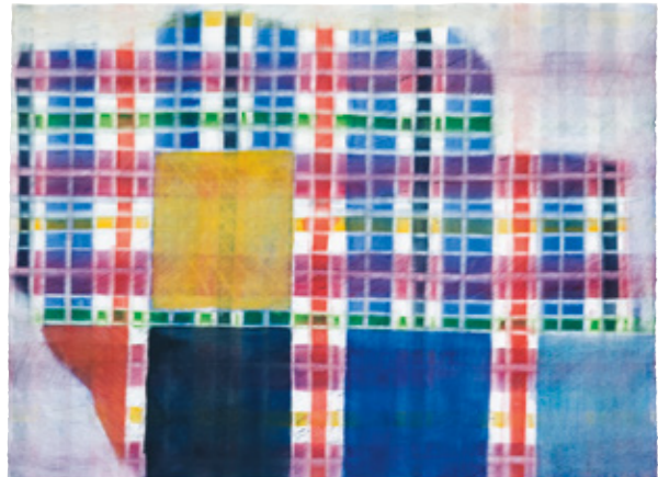
o. T., 2008, Aquarell auf Papier